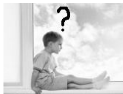
Jó idő van odakinn?