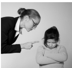
Ne csináld ezt!